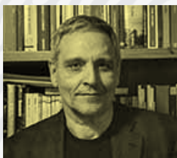
Maurizio de Giovanni