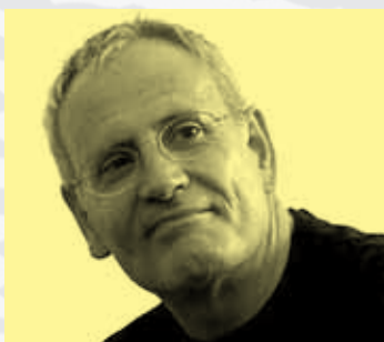
Ángel de la Calle

Le fiction noir sono giunte con gran successo alla graphic novel. La combinazione tra immagine e parola si adatta molto a questi universi nei quali le passioni umane si sviluppano in un mix di mistero, focus sociale e storia. Gli autori Ángel de la Calle e Romano de Marco spiegheranno, in questa tavola rotonda, i propri criteri rispetto a ciò che significa la narrativa criminale quando giunge al mondo del disegno e dei colori.